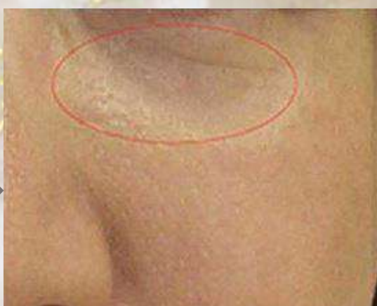
2週間に1回 4回施術後