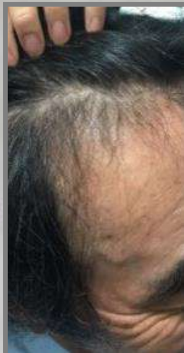
3週間に1回 4回施術3週間後