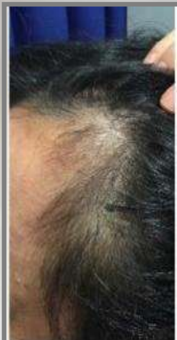
3週間に1回 4回施術3週間後