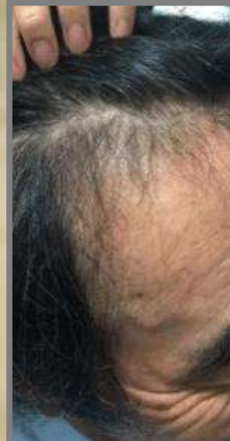
3週間に1回 4回施術3週間後