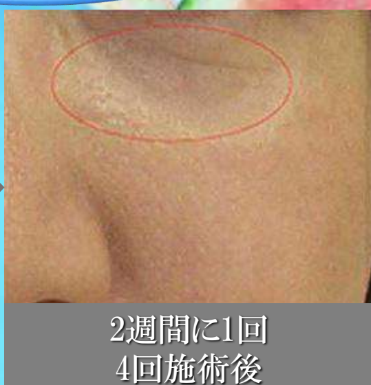
2週間に1回 4回施術後