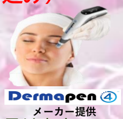
Dermapen 4